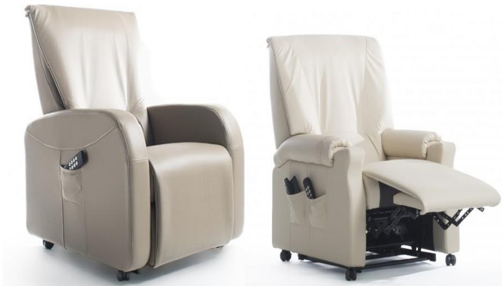
Abb. Modell REVILAX – Medilax Sessel