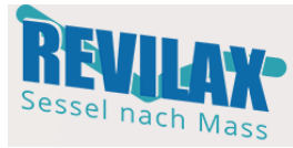
Abb. Modell REVILAX – Medilax Sessel